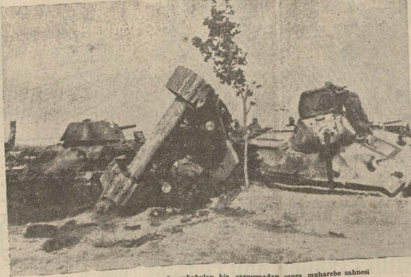
Sovyet ve Alman tankları arasında vukubulan bir çarpışmadan sonra muharebe sahnesi

Kalküta 7 (A.A.) — Meşhur Hind şairi Rabindranath Tagor ölmüştür.